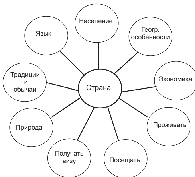
Рис. 2. Ассоциации по теме «Страны изучаемого языка»

Как известно, одной из эффективных современных педагогических технологий является технология развития критического мышления. Мною применяются некоторые из приемов с целью развития творческого мышления, побуждения учащихся к поиску новых, собственных путей решения проблем в процессе обучения иностранному языку. Различные стратегии данной технологии развивают умение воспринимать информацию, прогнозировать, работать с текстом, задавать вопросы. Одна из них — «Ассоциации» — стратегия, которая побуждает к размышлениям, обмену информацией по теме. Суть этой стратегии заключается в следующем: вначале в центре листа бумаги или на доске записывается ключевое слово, затем учащимся дается задание в течение 5–7 минут подумать и записать слова или фразы, наиболее тесно связанные с данной темой. После составления собственных ассоциаций учащиеся их озвучивают, работая в группах или в парах. Этот прием является весьма эффективным, так как позволяет мобилизовать интеллектуальную деятельность по лексическому материалу, изученному ранее, и спрогнозировать материал, который предстоит изучить. В ходе выполнения задания проявляется дух соревнования, повышается интерес к изучению определенной темы, особенно в среднем звене. В качестве примера приведем «ассоциации» по теме «Страны изучаемого языка» (рис. 2).