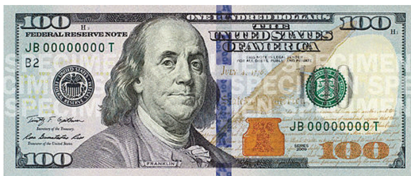
Рис. 1. Самое известное изображение ученого — члена Российской академии наук

системы, заново рождающей свои тексты в новых реалиях [7].